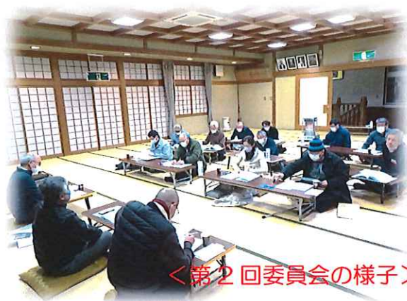
<第2回委員会の様子>