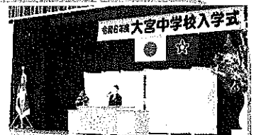
新入生 入学の言葉

後になりましたが、保護者の皆様へ、一言お祝い申し上げます。本日は、お子様のご入学、誠にありがとうございます。教職員一同、「チーム大宮中」として、それぞれの持ち場で、教育にあたる所存であります。学校と家庭で力を合わせ、地域の方々にもお世話になる中で、お子様の3年間の中学校生活を充実したものにしていきたいと思っております。