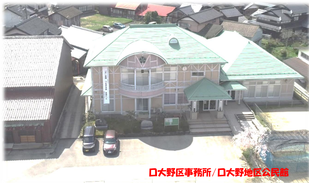
口大野区事務所 / 口大野地区公民館