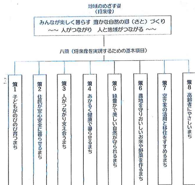
計画表紙と「三重・森本まちづくり八策」