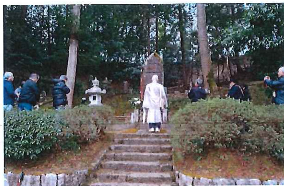
供養塔の前に移動して供養