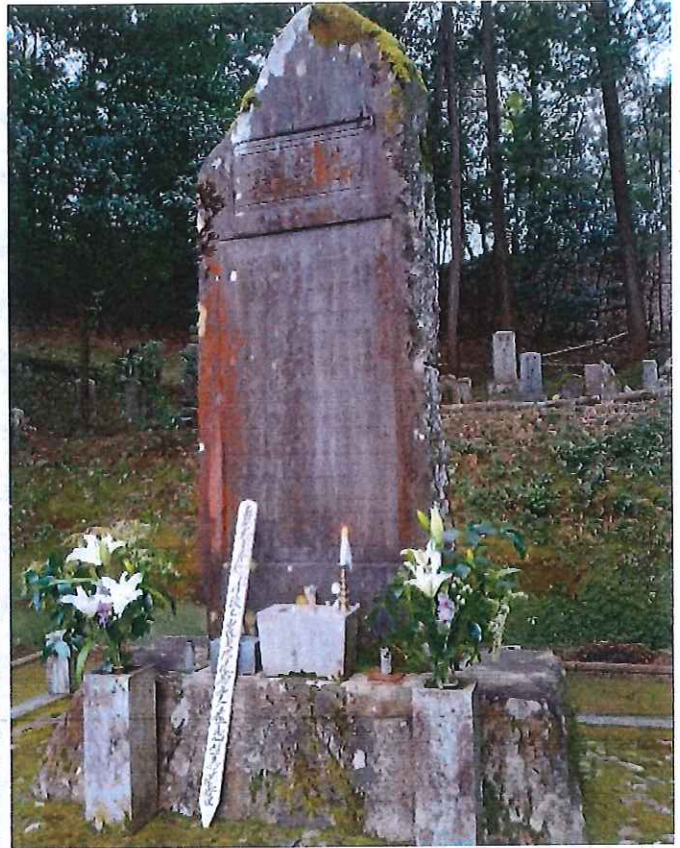
常德寺境内にある供養塔

常德寺(口大野)本堂南側の一段高くなった場所には、三十番神堂(京都府暫定登録文化財)があります。さらに一段高くなった場所には、97年前の丹後震災で亡くなった方々の供養塔があります。供養塔は、口大野村(当時)が昭和3年9月23日に建てたもので、表面には震災死亡者52名の氏名が、裏面には口大野村の被害状況などが記されています。常德寺では、毎年3月7日夕方に「丹後大震災供養」を行っています。