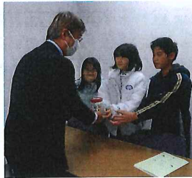
第1部 児童合唱団の子どもたちによるステージ 集まった募金は能登半島地震災害義援金へ

3月10日(日)午後、アグリセンター大宮で開催されました。第1部では、子どもたちが1年間練習してきた歌を、かわいい振り付けとともに披露しました。第3部は、第2部出演ゲストの「小町かんだあびれ」、「アンサンブルTree's」や合唱団を卒団した中学生の皆さんと一緒に、被災地を応援するべく復興応援ソングを歌い、会場は温かい歌声に包まれました。演奏会終了後、子ども達が能登半島地震支援募金への協力を呼びかけ、集まった募金12,279円は、令和6年能登半島地震災害義援金として大宮市民局長が受け取りました。