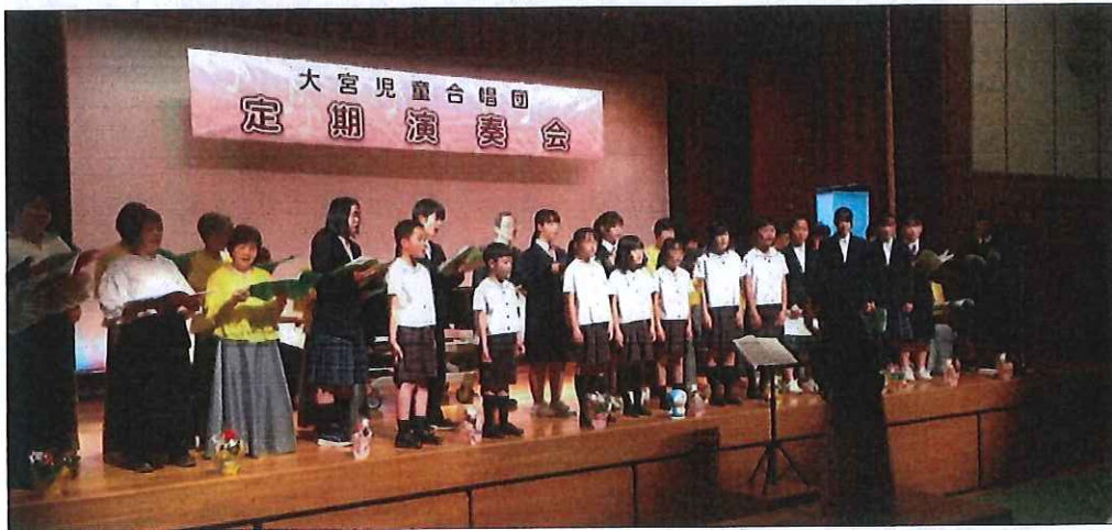
第3部「令和6年能登半島地震」復興応援ステージ